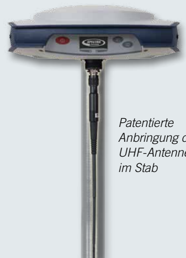
Patentierte Anbringung der UHF-Antenne im Stab